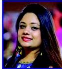
દર્શના પંકિત સાવલા સભ્ય