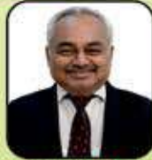
વસંત ચાંપશી ગડા (ગુંદાલા)