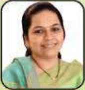
છાચા અજય છાડવા (મોટી ખાખર)