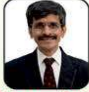
ઉત્કલ રતનજી ગડા (બાડા)