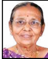
માપરના લીલબાઈ કુંવરશી ગોસર (ઉ.૮૧)

II નેત્રદાન માટે મૃત્યુબાદ તુરંત સંપર્ક કરો II સુ-મતિ ગુપ-મુલુડ (ઈ.) ૯૮૨૦૦૫૨૯૩૬