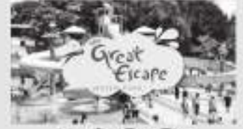
વન ડે પીકનિક