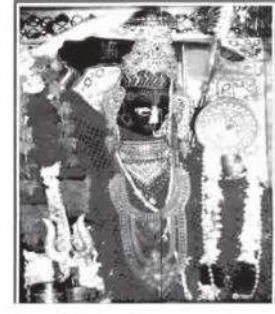
શ્રી સચ્ચા માતાજી