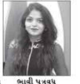
ભાવી પુત્રવધુ કેવના બીપીન ગાલા