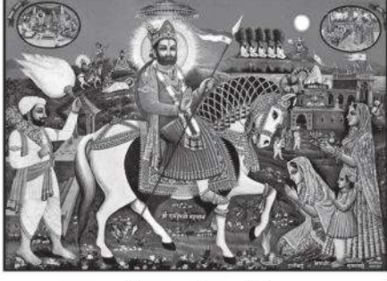
શ્રી રામદેવ પીર