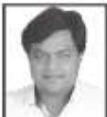
માવેશ કેશ્વી જાવા (ભચાઉ)