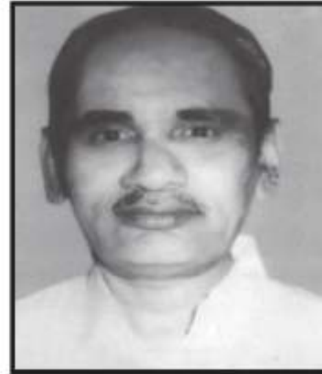
વેવાઈ શ્રી ચાંપશી નોંઘાભાઈ નંદુ ભયાઈ - ફોર્ટ