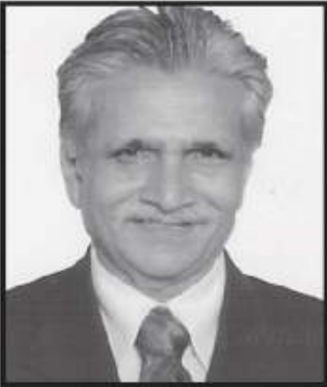
વેવાઈ શ્રી ભીમશી અવચર ગડા ઘાણીચર - ઘાણા