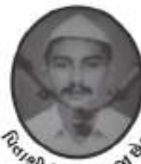
વિરાશી વેલજી વાઘજી છેડા