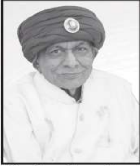
પિતાશ્રી રાયશી કરમશી સત્રા બાલા બાપુજી