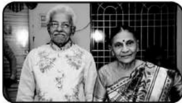
પૂણ્યશાળી દાતા દંપતિ

પ્રભાસ પાટણ, વંથલી, ઢંકગીરી, સોમનાથ, નાગેશ્વર ધામ, ખોડલ ધામ, જેવા તીર્થસ્થળો એવા છે જ્યાં વારંવાર જવાનું મન થાય એ દરેક સ્થળે પરમ આનંદ નો અહેસાસ થયો.