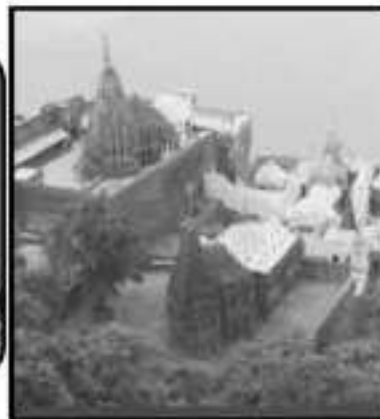
શ્રી ગીરનારક તીર્થ