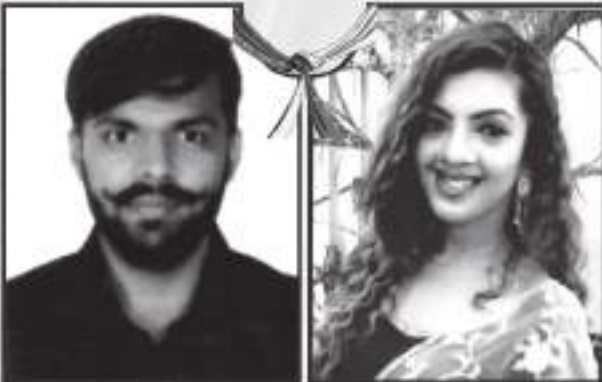
૨જે માળે સાંજે વિ. રીતેશ રામજી ડાહ્યાલાલ શાહ - સીવલખા વિ. પાવલ ડસ્તાની કુંભરતી માલા - લાડડીયા