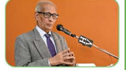
મહાન વૈજ્ઞાનિક જે. જે. રાવલ