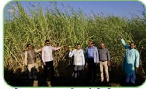
જોવા લાયક ૧૦૦ એકરમાં પોષ્ટીક આહાર ગજરાજ ઘાસ, જીંજવા ઘાસ, નેપીયર ઘાસ