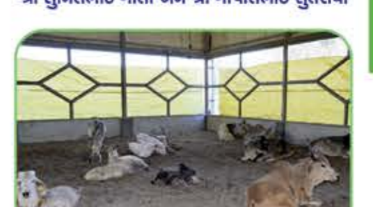
આઈ. સી. યુ. માં સારવાર લેતા પશુઓ

બે દિવસના કાર્યક્રમ અંતર્ગત વિવિધ સંસ્થાઓમાંથી પધારેલ મહાનુભાવો તથા સેવા આપનાર સ્વયંસેવકો, કાર્યકર્તાઓ તથા નામી-અનામી સહકાર આપનાર સર્વેનો આભાર તથા ભવિષ્યમાં આવા જ સાથ-સહકારની અપેક્ષા સમગ્ર કાર્યક્રમ આપ You Tube ના માધ્યમથી નીચે આપેલ લિંક દ્વારા જોઈ શકશો.