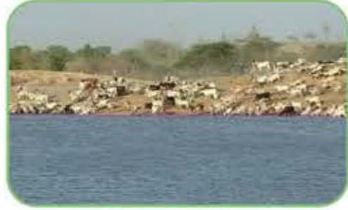
૩૫ એકરમાં ભવ્ય નંદીસરોવરનું નિર્માણ