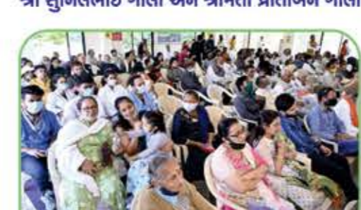
મોટી સંખ્યામાં હાજર રહેલ જીવદયા પ્રેમીઓ