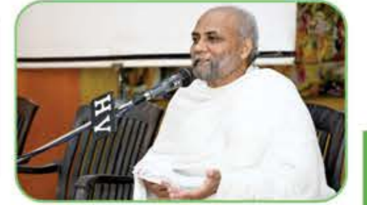
જૈન ગુરૂ ભગવંત દ્વારા પ્રવચન